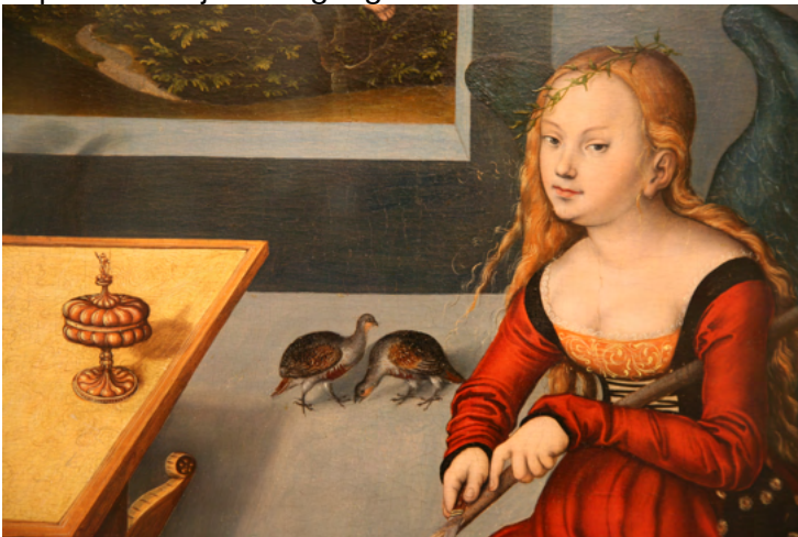
Detail of Melancholy, Lucas Cranach the Elder, 1532

I denna essä kommer vi inte ge såna hemska profetior utan kommer rikta vårt fokus genom att undersöka två allierade och interaktiva karaktärsdrag hos denna Ishmaeliska precaritet. Den första rör krisen för Europas modernitet, dess inre tomhet, för vi kan knappast hoppas att förstå den växande anti-Ishmael-aktivismen hos vår kontinents höger och vänster utan att konceptuellt och empatiskt äntra rummet för slutet av modernitet och de trauman som bor där. Matthew Arnold förutsåg och gav en röst till en melankoli som nu har spridit sig över landmassorna som ett mörkt och sorgset moln: Europa har inte längre en Gud, och därmed hörs allt som ett skrik från trasiga bitar som snurrar runt i meningslösa men ovanligt starka cykler av framgång och tillbakagång. Det finns ingen domedag som ger mening till tiden och det finns inte ens ett hegelianskt löfte om synopsis och linjär framgång.