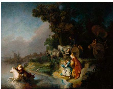
The Abduction of Europa, Rembrandt, 1632

Islamofobi påminner också om den gamla antisemitiska paranoian om den "orientaliska" fienden på insidan: när Christian Worch, en nutida tysk ledare inom extremhögern, blev frågad "Är islam ett större hot än internationell judendom?" svarade han enkelt att "fienden förändras" 15 . En förutsägbar och familjär myggsvärm med antimuslimska skribenter har stigit upp ur detta skadliga och avundsjuka träsk, propagerar målande, men alltid föraktande, konspirationsteorier, där den mest populära är "The Great Replacement Theory", som nu accepteras av en fjärdedel av den franska befolkningen, vilken fastslår att en elitstyrka av illuminati konspirerar för att ersätta infödda européer med muslimer. 16 Bästsäljande författare som Oriana Fallaci, Éric Zemmour och Douglas Murray sätter skräck i européer med absurda parodier på islamska lagar, deras serier tjänar som sentida "chansons de geste", skapade för att roa och varna publiken, för att honorera en ny sorts korstågstrubadurer och för att forma populistiska politikernas hjärnor och lagens organ. 17 Dessa författare sätter en standardiserad kanon av snedvridningar och väl utvalda citat i ruljans och ignorerar det Europeiska universitetet lär ut (vilka generellt sett är medvetna om mångfalden och flexibiliteten hos islamska traditioner). Historiker kan påminnas om Julius Streicher - den nazistiska antisemitiska skribenten som, under sin rättegång i Nuremberg, drog fram en lång lista med citat från Toran och Talmud.