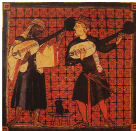
Illustration of Muslim and Christian oud players from Cantigas de Santa Maria, a collection of Galician-Portuguese devotional songs, c. thirteenth century

Europa är, jämfört med Ishmaels vändor för att nå det, inte ett paradys; det är hemsökt av Sobibors och Srebrenicas spöken och krampar av återuppstående vanor för skrämde främlingsfientliga andra; och en teologi för mänsklig reaktion mot kontinentens diskursiva våld och växande in-